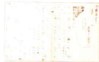
「手袋を買いに」直筆原稿