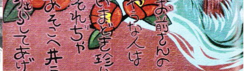
「午をつないだ樹の木」壁画(安城町)